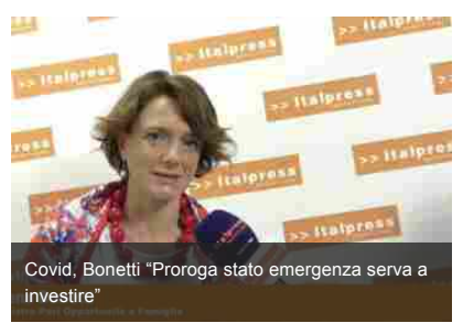
Covid, Bonetti "Proroga stato emergenza serve a investire"