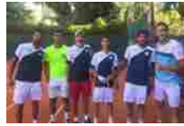
Tennis A1: Sinalunga sconfitta a Genova 4-2 Leggi l'articolo intero...